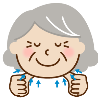
顎下腺マッサージ

耳の下から顎の下まで、3～4か所を、順に押していく。目安は、各ポイントをゆっくり5回くらいずつ。