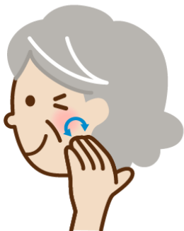
耳下腺マッサージ

指数本を耳の前（上の奥歯あたり）に当て、指全体で10回ほどくるくるとやさしくマッサージ。